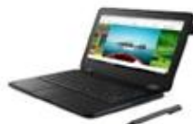
Lenovo 300 e Yoga Winbook