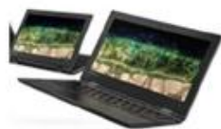
Lenovo 500 e Chromebook