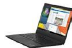
Lenovo ThinkPad – Performance